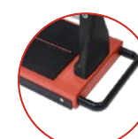
■ Pega e rodas na base para facilitar o transporte.