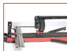
■ Carrinho e pega ergonómicos para facilitar a utilização.