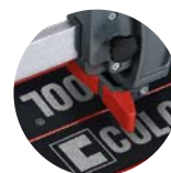
■ Separador de peças.