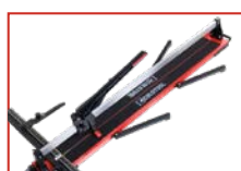
■ Duas extensões laterais para segurar peças grandes.